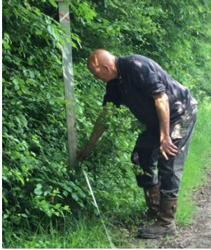
Préparation de la pose des poteaux du GATEAU et de LA FOLIE 22 mai 2024